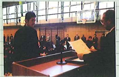
読書感想文コンクール表彰式

読書感想文コンクールの表彰式でのものです。校内選考が選ばれた方々一人一人に校長先生から賞状がわたされました。右下の写真は2月10日(土)(放課後)に開かれた校長先生と語る会の風景です。校長先生が自分の高校生・大学生時代のお話をしてくれました。びっくりする話などとても楽しい話を約1時間聞かせていただきました。