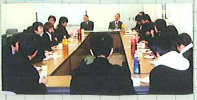
読書感想文コンクール多読者賞受賞者と校長先生の語る会

左の写真はお正月明けに行われたものです。校内選考が選ばれた方々一人一人に校長先生から賞状がわたされました。右下の写真は2月10日(土)(放課後)に開かれた校長先生と語る会の風景です。校長先生が自分の高校生・大学生時代のお話をしてくれました。びっくりする話などとても楽しい話を約1時間聞かせていただきました。