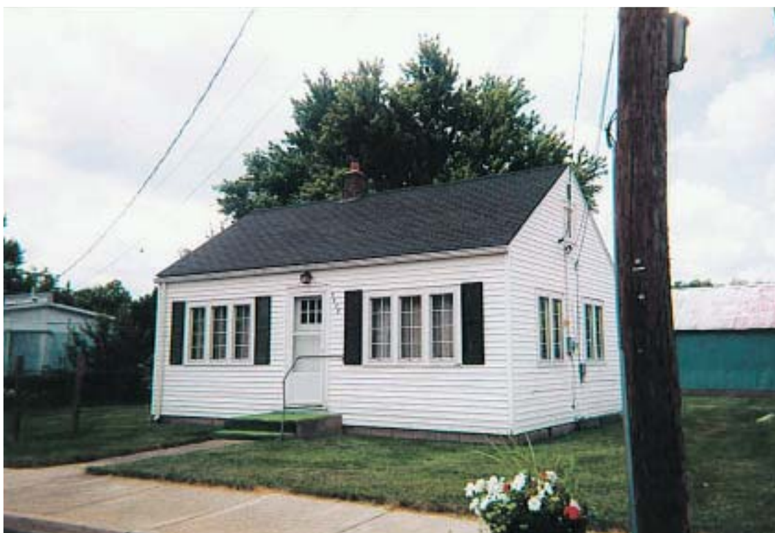
「Old Peck Library,circa 1930」